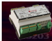
TABELLA CABLAGGIO DRELAY02