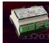
TABELLA CABLAGGIO DT8I20_1