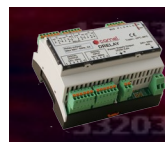
TABELLA CABLAGGIO DT808_2