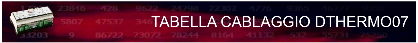
TABELLA CABLAGGIO D THERMO07