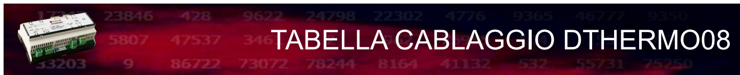
TABELLA CABLAGGIO D THERMO08